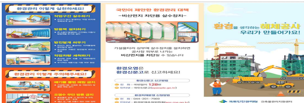
분진저감 아이디어 '분진망에 살수 스프레이 연결'