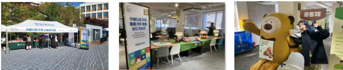
대학 내 외국인 교환학생 기부 참여를 위한 팝업부스 운영