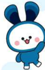
개선 후 캐릭터 디자인